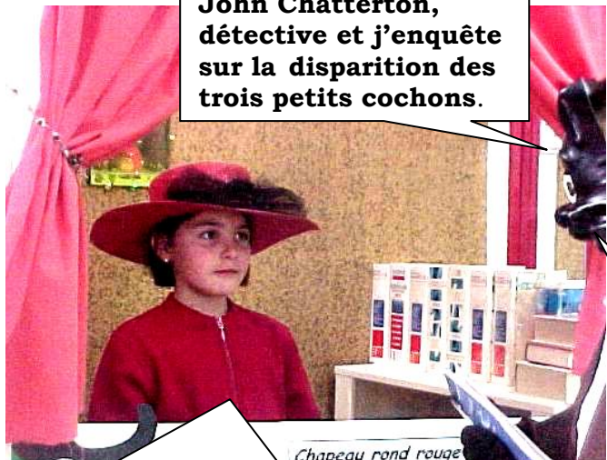
Chapeau rond rouge

Bonjour, je m'appelle John Chatterton, détective et j'enquête sur la disparition des trois petits cochons.