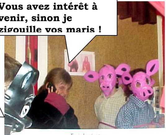
Ici habite Chaperon rouge La tueuse de loups

Oh ! Je ne savais pas que Chaperon rouge était une criminelle !