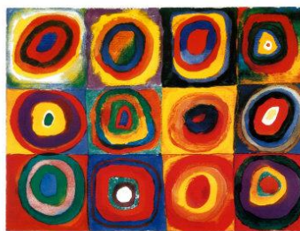
WASSILY KANDINSKY SQUARES WITH CONCENTRIC RINGS