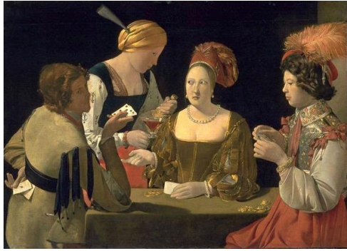
Georges de la Tour

Décrire une œuvre et faire parler les personnages du tableau