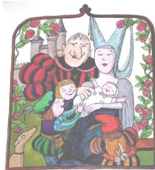
Le Géant de Zéralda T Hungerer