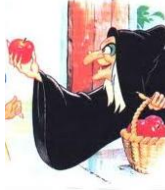
Ah ! les bonnes soupes. C Boujon Blanche neige dessin animé W Disney

Dans le grand chaudron, elle mélange des pommes de terre, des carottes, des navets, des trucs et des machins. Puis elle épluchonne et remue le mélange. « Bouillonne, bouillonne, ma bonne soupe, Pour que bientôt, dans ma gamelle, Se trouve ce qui me fera belle, Des choses jusqu'à la coupe... »